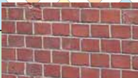
ドイツ積み (小口積み)